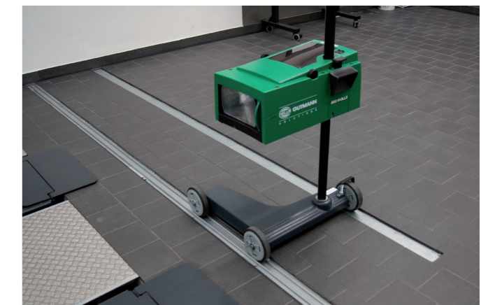
BILD 4: SEP mit versenkter Schienenkonstruktion

Bei Einsatz einer Schienenkonstruktion ist es sinnvoll, diese bodeneben einzubauen. Dadurch können Verformungen durch darüber rollende Fahrzeuge vermieden werden (Bild 4).